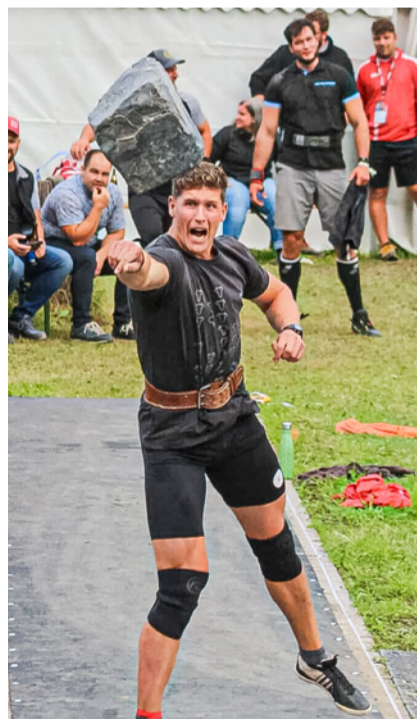
Am Samstagnachmittag stand der Wenslinger im Dauereinsatz.

Den Unspunnen-Final der besten fünf in der grossen Arena haben Sie